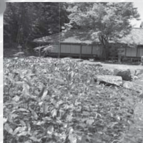
大照院の池泉庭園