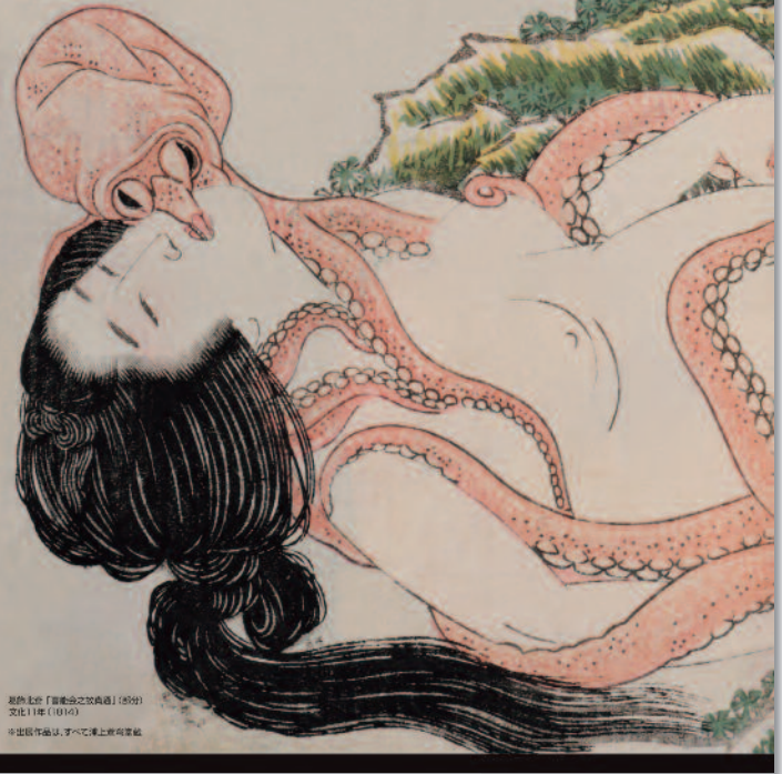
葛飾北斎「蛸と海女」(約1850年) 文化11年(1816) ※出品作品は、すべて浦上満氏蔵