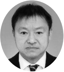
白上陽一郎 宗教法人松陰神社