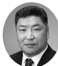
伊勢島紀行 伊勢島修石材店