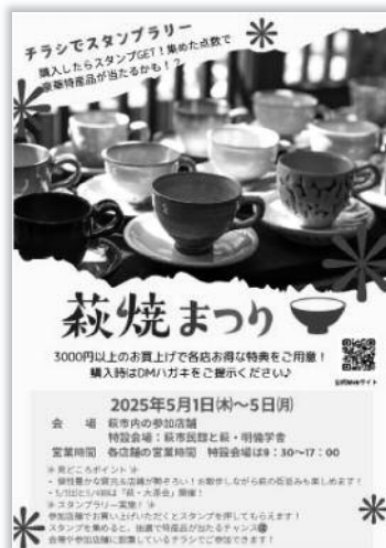
デザイン初心者の職員が作った 製作物例

画像生成、背景削除、テキスト自動作成等、AI を活用した機能が多数利用でき、作業効率が劇的に向上します。