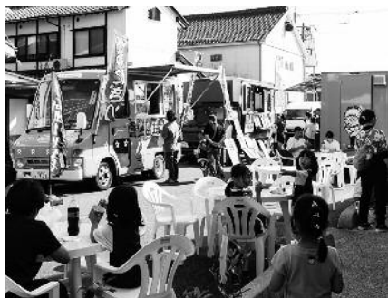
キッチンカーが7台出店

また、田町商店街の西側エリアではハンドメイドマーケット「萩Fes」が開催され、雑貨類の販売やワークショップが行われました。 田町商店街中央には県内からキッチンカーが集まり、器探しの合間に食事しながら休憩できるスペースが設けられました。 12日(日)には、音楽イベント「竹灯路音楽会」も実施され、賑わいあるイベントとなりました。3日間の来場者数は19,020人(前回実績20,450人)となりました。