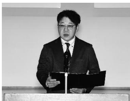
金委員長経過報告