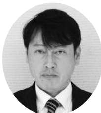
山根 幸裕 (有)山根建築