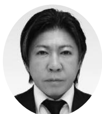
阿武 周平 (有)あんの建装