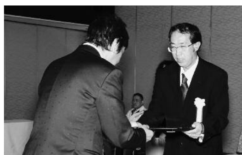
賞状と記念品が贈られました