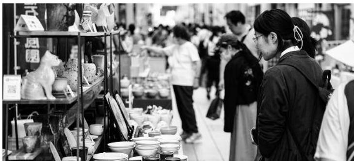
田町商店街には24店が出店

昨年に引き続き、各会場には「萩焼コンシェルジュ」を配置し、出店店舗のご案内や、器探しのアドバイスをいたしました。