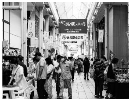
期間中は多くの来場者で賑わいました