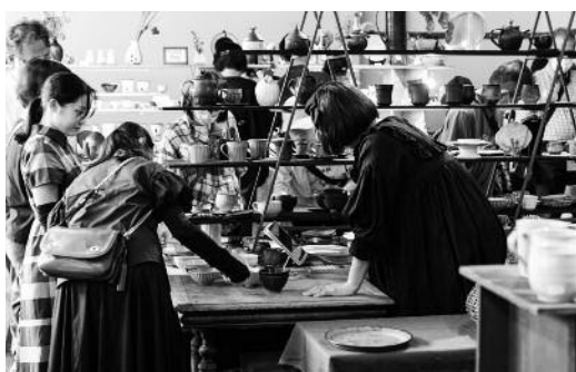
萩・明倫学舎には9店が出店

また、会場巡りを愉しんでいただく企画として「DMハガキでスタンプラリー」を実施。DMを持参された方に、それぞれの会場で萩の特産品をお渡ししたほか、お買上げ特典も用意いたしました。来場された方の多くの方々は、両会場へ足を運び、スタンプラリーを楽しまれていました。