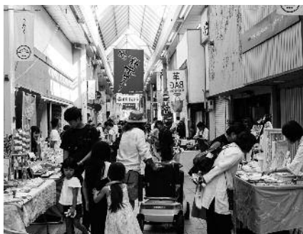
人気のハンドメイド展「萩Fes」