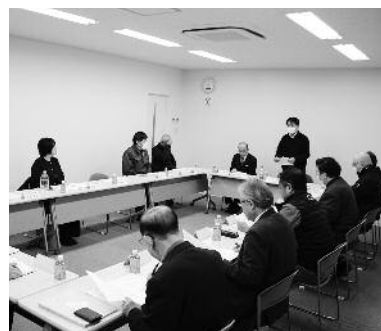
サービス輸送部会常任委員会

今回開催されたすべての部会では、萩市の関係部署の担当者に出席していただき、意見交換会を実施し、部会員に関係した市の施策等について、部会員より質問または担当部署への要望を行いました。 意見交換会終了後、すべての部会で、令和8年度の部会活動の事業計画について協議を行い、次年度の部会活動の方向性を決定しました。