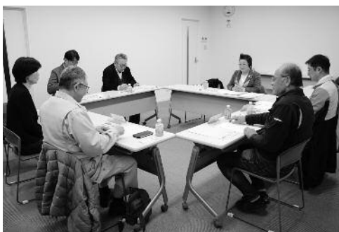
商業部会常任委員会